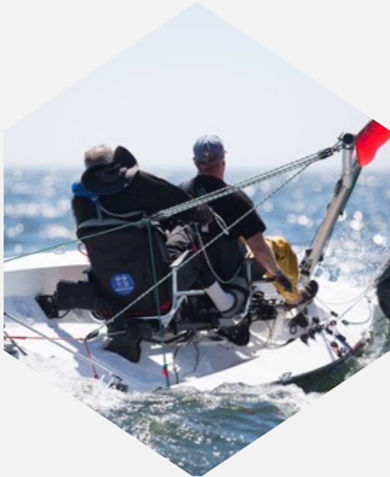
Inklusion & Segeln & Helga Cup & Bundesliga & Hamburg