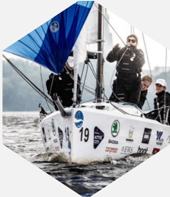
Inklusion & Segeln & Helga Cup & Bundesliga