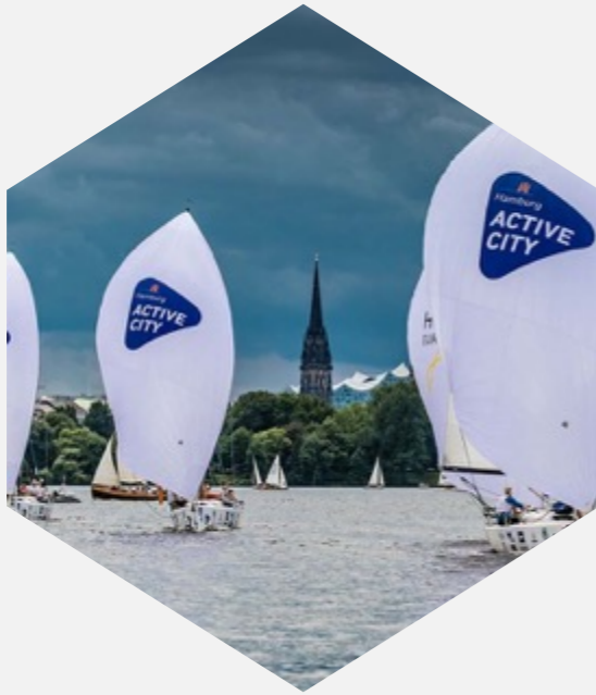
Inklusion & Segeln & Helga Cup