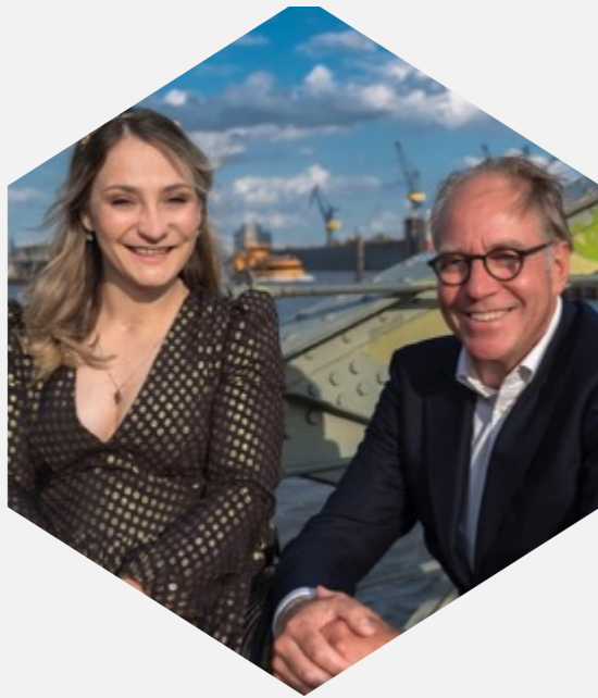
Inklusion & Segeln & Helga Cup

Schirmherrin (Helga Cup & Helga Cup .Inklusion): Bahnrad-Olympiasiegerin Kristina Vogel